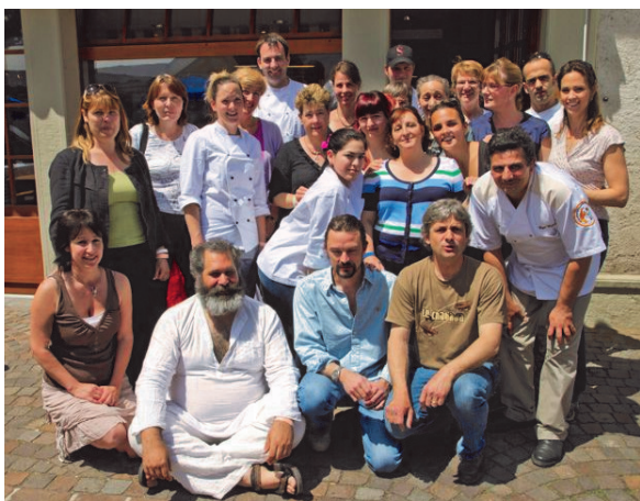
Le personnel et Malcolm Braff, pianiste de jazz et ses deux musiciens

Dimanche 20 mai, on se bousculait sur la place du village pour trouver une place assise lors du grand brunch organisé par Christian Fayet et son épouse. Tout était programmé pour que la fête soit totale, le soleil même a daigné s'inviter, lui qui nous avait boudé depuis de longs jours. Des mois de préparation ont été nécessaires pour mener à bien une telle manifestation, inédite au village. Les autres commerçants pranginois ont également joué le jeu et ils