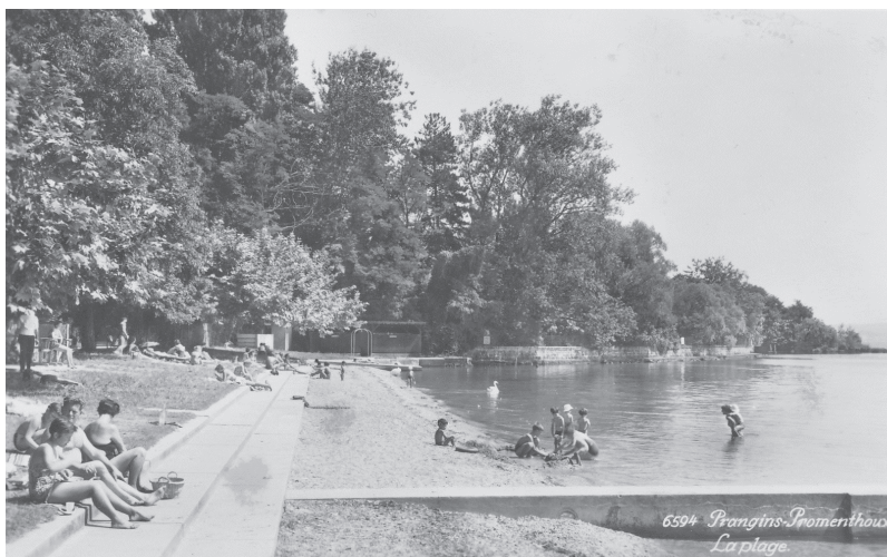
La plage de Promenthoux dans les années 50 avec sa cabane en bois

Saviez-vous qu'au Moyen-âge, Promenthoux était un village d'une certaine importance ? Ce qui explique qu'il est représenté par l'une des mains, avec Bénex et Prangins, qui figure sur le drapeau de la Commune. Le nom de cette agglomération vient sans doute de sa position : un promontoire formé par les dépôts de la Promenthouse, s'avancant dans le lac. On y a recensé des moulins et un battoir au service du baron de Prangins. Au milieu du 19 e siècle, gravières, moulins et scieries étaient activement exploités. Trois cafés y avaient même vu le jour ainsi qu'un poste de gendarmerie chargé de surveiller les débarquements clandestins.