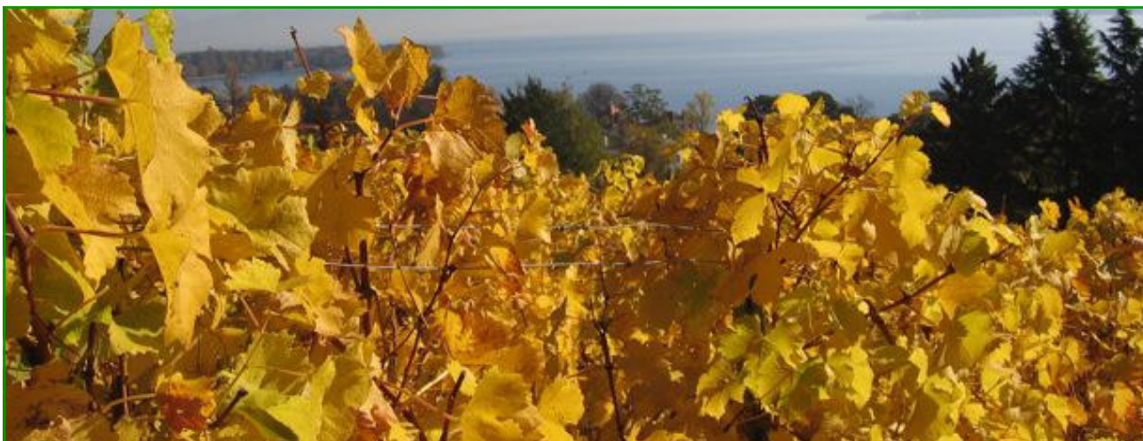
Des vignes à Prangins